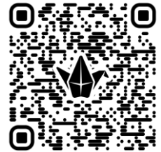
「童」創空間影片上傳 二維碼

學生須在暑假內完成以上課業，並於新學年開學日(二零二六年九月一日)或前交回學校。敬請家長提醒子女妥善安排暑期時間，完成假期課業及多閱讀課外書籍。為鼓勵學生積極完成暑期課業，完成所有指定暑期課業的學生，可獲贈精美禮物乙份。